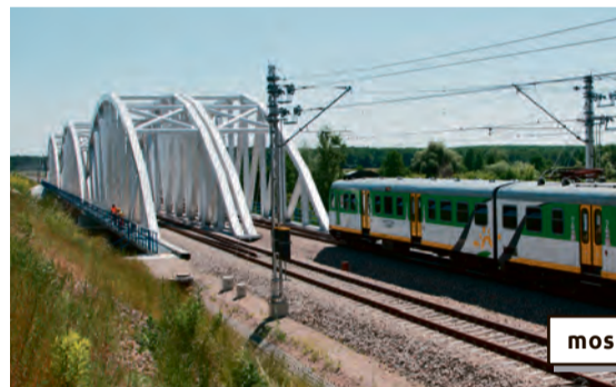
most nad Pilicą