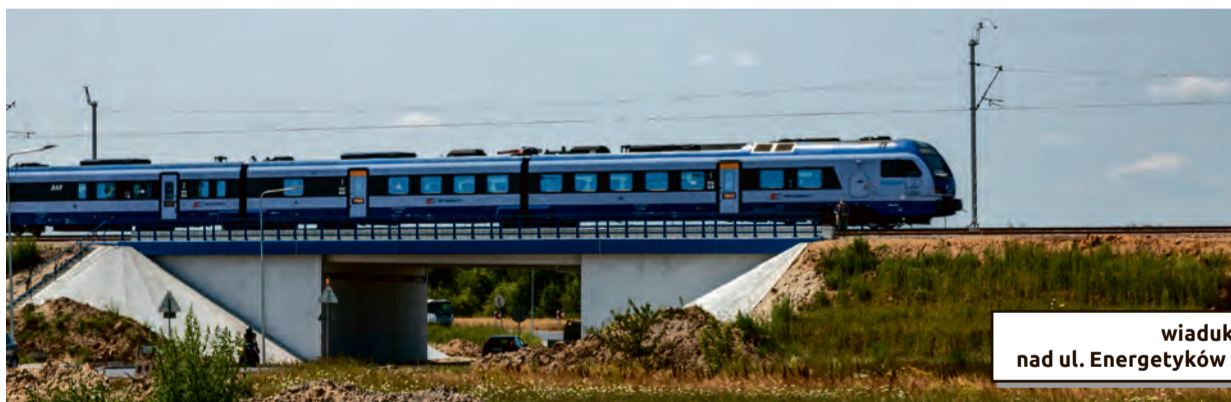
wiadukt kolejowy nad ul. Energetyków w Radomiu