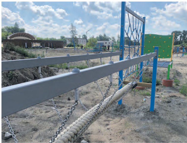
Gmina Białobrzegi otrzymała 3,5 mln zł na ścieżkę przyrodniczą przy zbiorniku wodnym i drugi etap zagospodarowania terenów nadpilicznych

drogi gminnej Janików – Dąbrówki, Głowaczów – 2 mln zł na budowę dróg gminnych, a Błędów – prawie 1 mln zł na przebudowę drogi gminnej Głudna – Trzylatków Duży oraz ponad 1,1 mln zł na przebudowę dróg we wsi Wilhelmów. Do Mogielnicy trafi prawie 3,4 mln zł na przebudowę drogi gminnej Otalążka – Jastrzębia Stara, a do Potworowa – prawie 2 mln zł na przebudowę dróg na te-