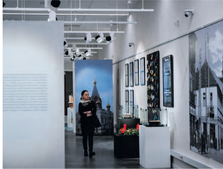
Trzecie miejsce przypadło wystawie „Bliscy-dalecy. O zimowym świętowaniu” w Muzeum Historii Najnowszej Radomia

Także wśród wyróżnionych w tej kategorii znalazła się radomska placówka – to Mazowieckie Centrum Sztuki